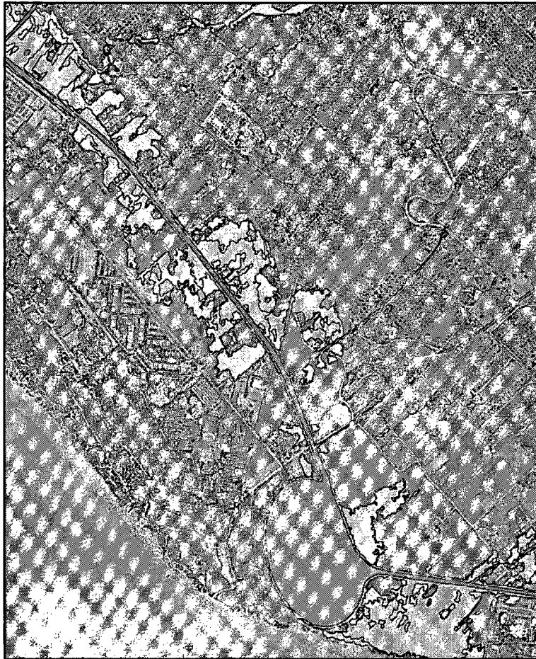
Fig. 2 – Perimetrazione senza modifiche (a); perimetrazione con modifiche (b)