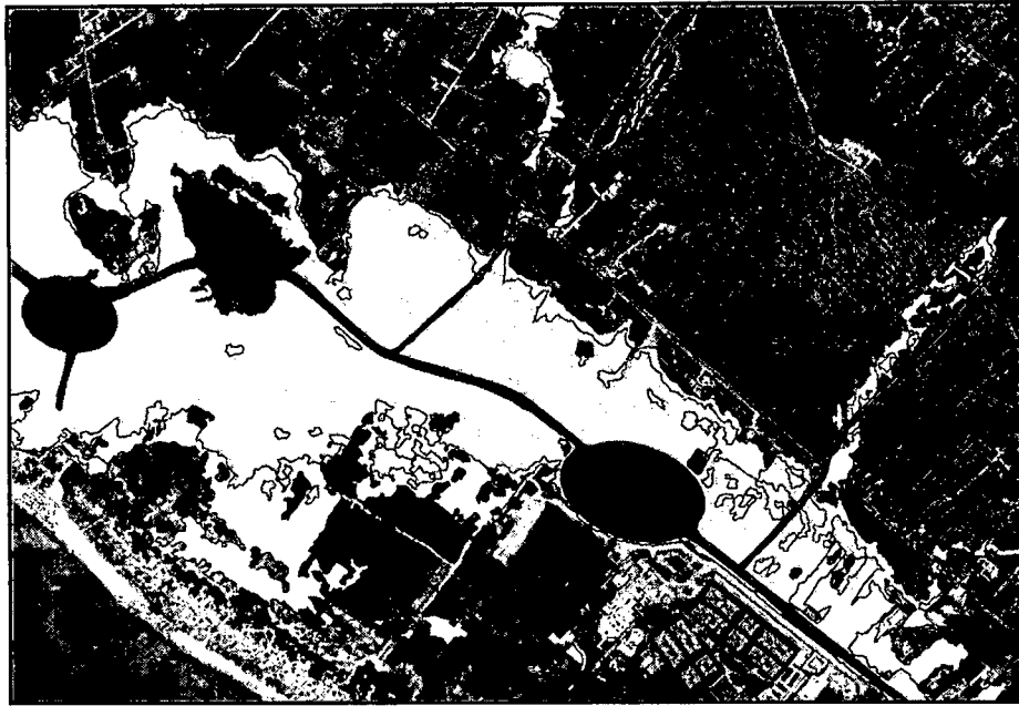
Fig. 1 – Perimetrazione senza modifiche (a); perimetrazione con modifiche (b)